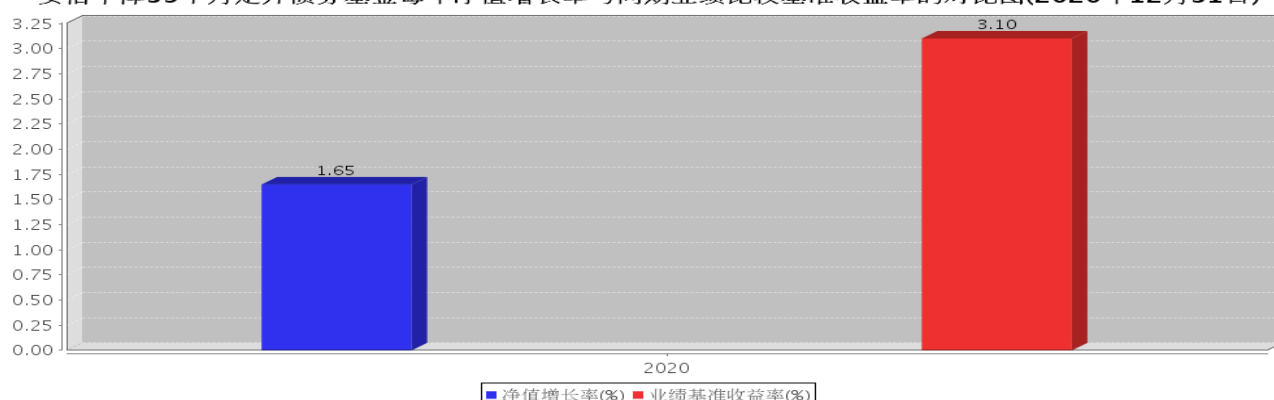
安信丰泽 39 个月定开债券基金每年净值增长率与同期业绩比较基准收益率的对比图(2020 年 12 月 31 日)

注:本基金合同生效日为 2020 年 3 月 5 日,合同生效当年期间的相关数据按实际存续期计算。基金的过往业绩并不代表其未来表现。