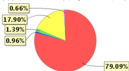
投资组合资产配置图表(2021年3月31日)

● 固定收益投资 ● 买入返售金融资产 ● 其他各项资产 ● 权益投资 ● 银行存款和结算备付金合计