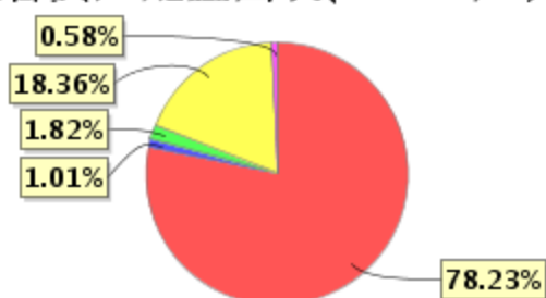
投资组合资产配置图表(2021年3月31日)

● 固定收益投资 ● 买入返售金融资产 ● 其他各项资产 ● 权益投资 ● 银行存款和结算备付金合计