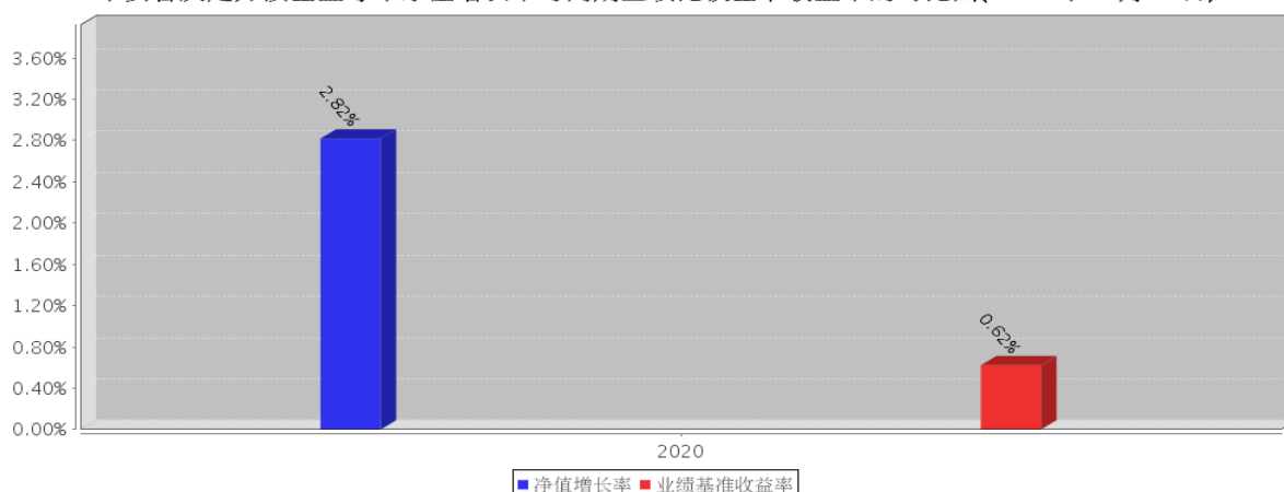
平安合庆定开债基金每年净值增长率与同期业绩比较基准收益率的对比图(2020年12月31日)