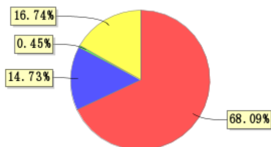
投资组合资产配置图表(2021年3月31日)

● 固定收益投资 ● 买入返售金融资产 ● 其他各项资产 ● 银行存款和结算备付金合计