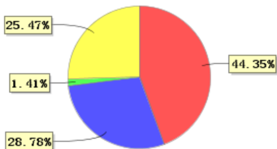
投资组合资产配置图表(2021年3月31日)

● 固定收益投资 ● 买入返售金融资产 ● 其他各项资产 ● 银行存款和结算备付金合计