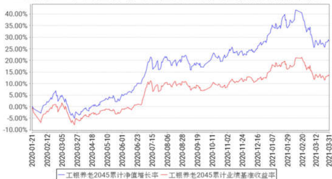
工银养老2045累计净值增长率与同期业绩比较基准收益率的历史走势对比图