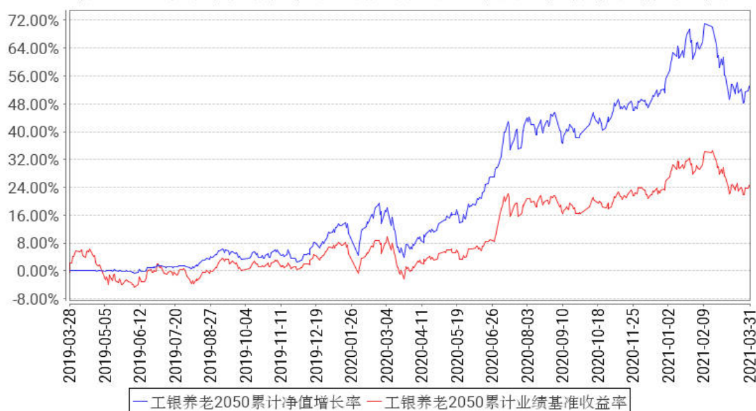
工银养老2050累计净值增长率与同期业绩比较基准收益率的历史走势对比图