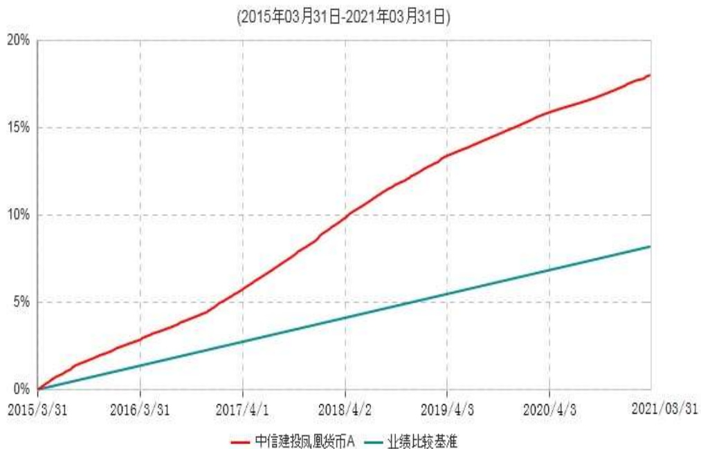
中信建投凤凰货币A累计净值收益率与业绩比较基准收益率历史走势对比图