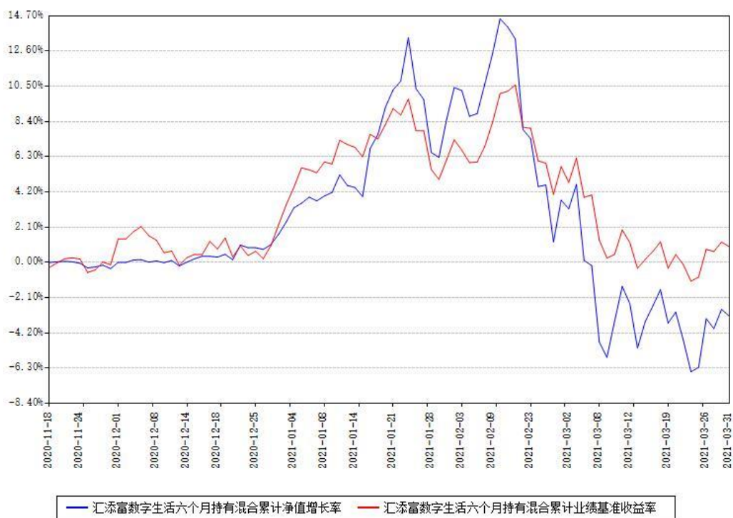
汇添富数字生活六个月持有混合累计净值增长率与同期业绩基准收益率对比图