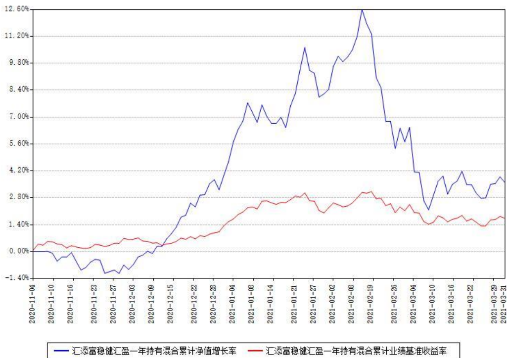
汇添富稳健汇盈一年持有混合累计净值增长率与同期业绩基准收益率对比图