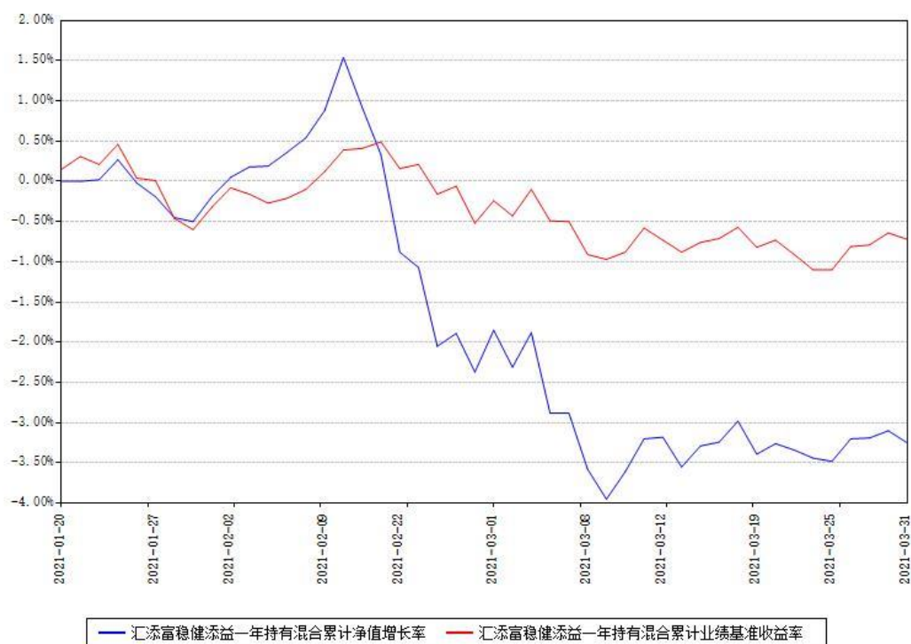
汇添富稳健添益一年持有混合累计净值增长率与同期业绩基准收益率对比图