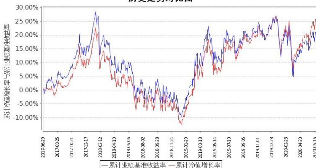
图 1：嘉实富时中国 A50ETF 联接基金 A 基金份额累计净值增长率与同期业绩比较基准收益率的历史走势对比图 (2017 年 6 月 29 日至 2020 年 6 月 30 日)