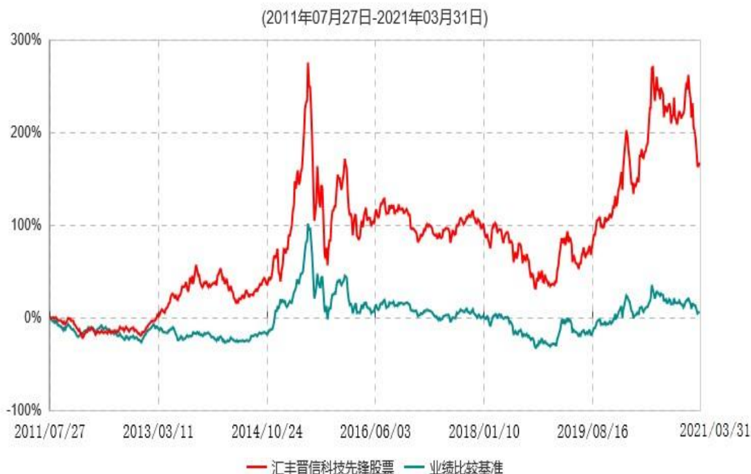
汇丰晋信科技先锋股票型证券投资基金累计净值增长率与业绩比较基准收益率历史走势对比图