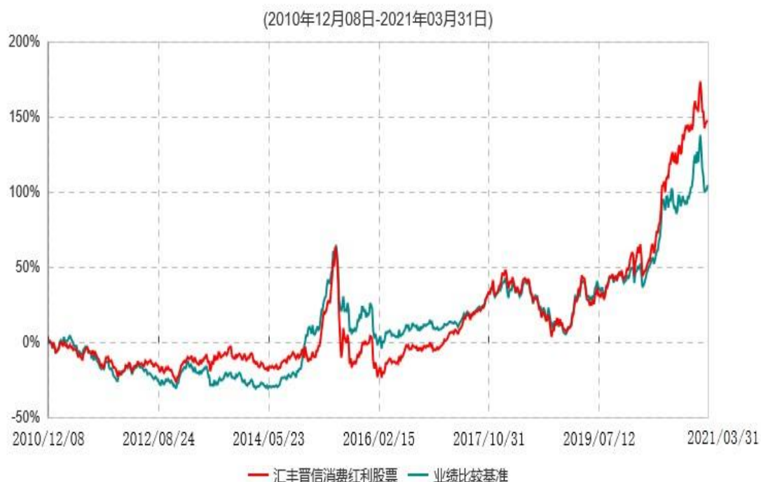
汇丰晋信消费红利股票型证券投资基金累计净值增长率与业绩比较基准收益率历史走势对比图

注：1. 按照基金合同的约定，本基金的投资组合比例为：股票投资比例范围为基金资产的 85%-95%，权证投资比例范围为基金资产净值的 0%-3%。固定收益类证券、现金和其他资产投资比例范围为基金资产的 5%-15%，其中现金（不包括结算备付金、存出保证金、应收申购款等）或到期日在一年以内的政府债券的投资比例不低于基金资产净值的 5%。按照基金合同的约定，本基金自基金合同生效日起不超过 6 个月内完成建仓，截止 2011 年 6 月 8 日，本基金的各项投资比例已达到基金合同约定的比例。