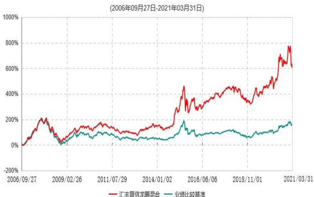
汇丰晋信龙腾混合型证券投资基金累计净值增长率与业绩比较基准收益率历史走势对比图