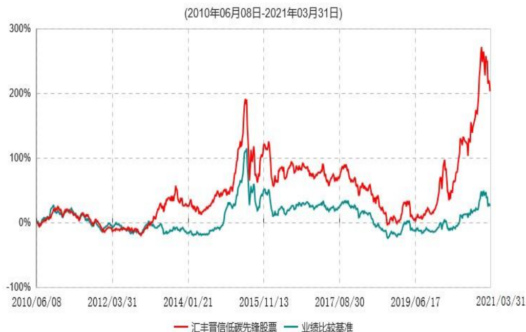
汇丰晋信低碳先锋股票型证券投资基金累计净值增长率与业绩比较基准收益率历史走势对比图