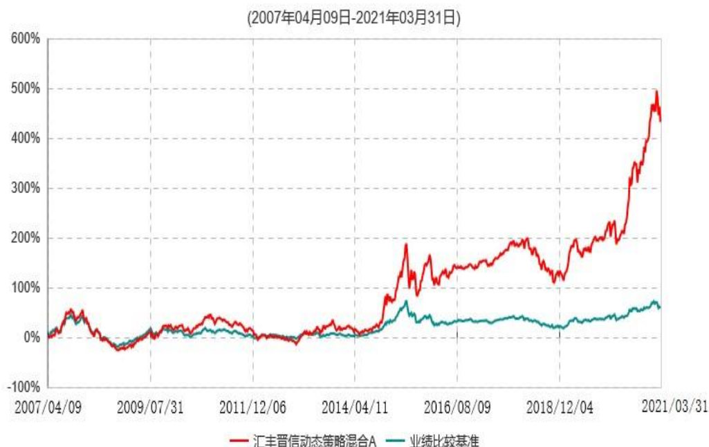
汇丰晋信动态策略混合A累计净值增长率与业绩比较基准收益率历史走势对比图

注：1. 按照基金合同的约定，本基金的投资组合比例为：股票占基金资产的 30%-95%；除股票以外的其他资产占基金资产的 5%-70%，其中现金（不包括结算备付金、存出保证金、应收申购款等）或到期日在一年期以内的政府债券的比例合计不低于基金资产净值的 5%。本基金自基金合同生效日起不超过六个月内完成建仓。截止 2007 年 10 月 9 日，本基金的各项投资比例已达到基金合同约定的比例。