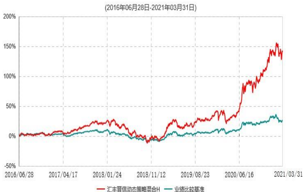
汇丰晋信动态策略混合H累计净值增长率与业绩比较基准收益率历史走势对比图

注：1. 按照基金合同的约定，本基金的投资组合比例为：股票占基金资产的 30%-95%；除股票以外的其他资产占基金资产的 5%-70%，其中现金（不包括结算备付金、存出保证金、应收申购款等）或到期日在一年期以内的政府债券的比例合计不低于基金资产净值的 5%。