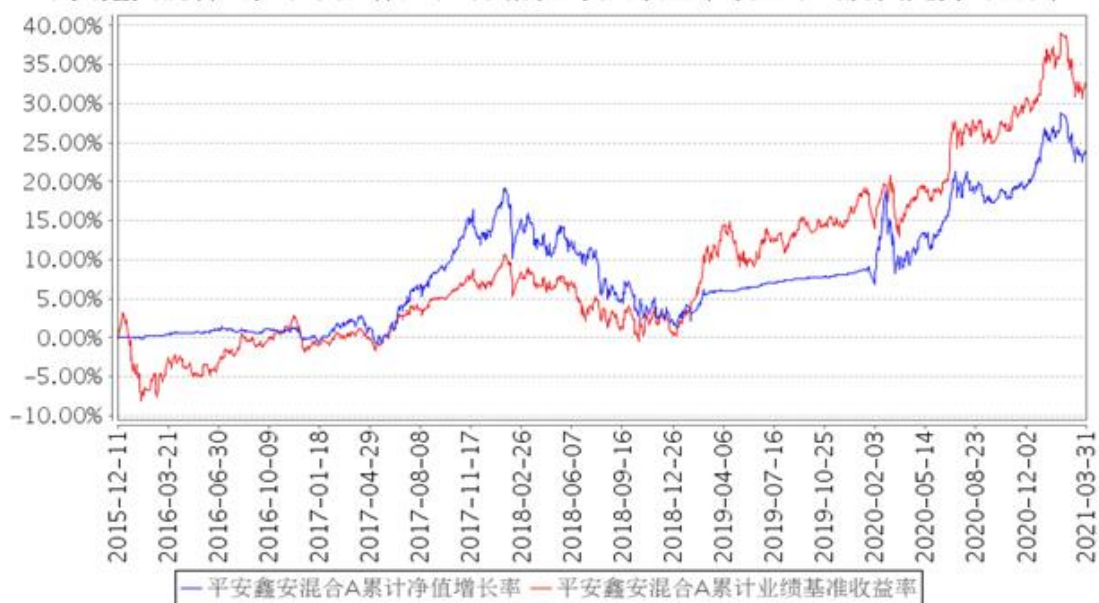
平安鑫安混合A累计净值增长率与同期业绩比较基准收益率的历史走势对比图