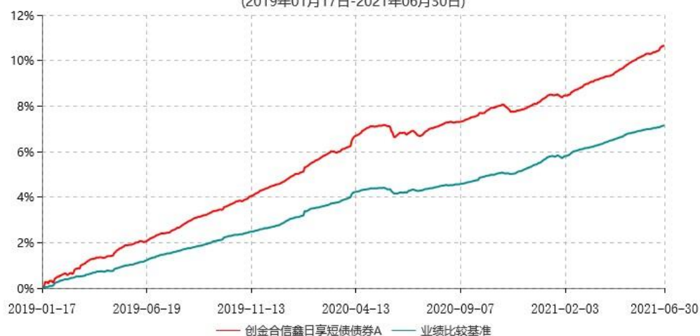
创金合信鑫日享短债债券A累计净值增长率与业绩比较基准收益率历史走势对比图 (2019年01月17日-2021年06月30日)