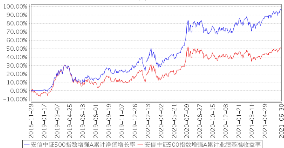
安信中证500指数增强A累计净值增长率与同期业绩比较基准收益率的历史走势对比图