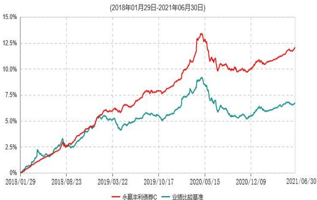
永赢丰利债券C累计净值增长率与业绩比较基准收益率历史走势对比图