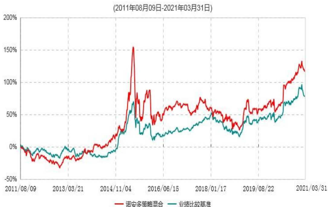
诺安多策略混合型证券投资基金累计净值增长率与业绩比较基准收益率历史走势对比图

二、自基金合同生效以来基金份额累计净值增长率变动及其与同期业绩比较基准收益率变动的比较