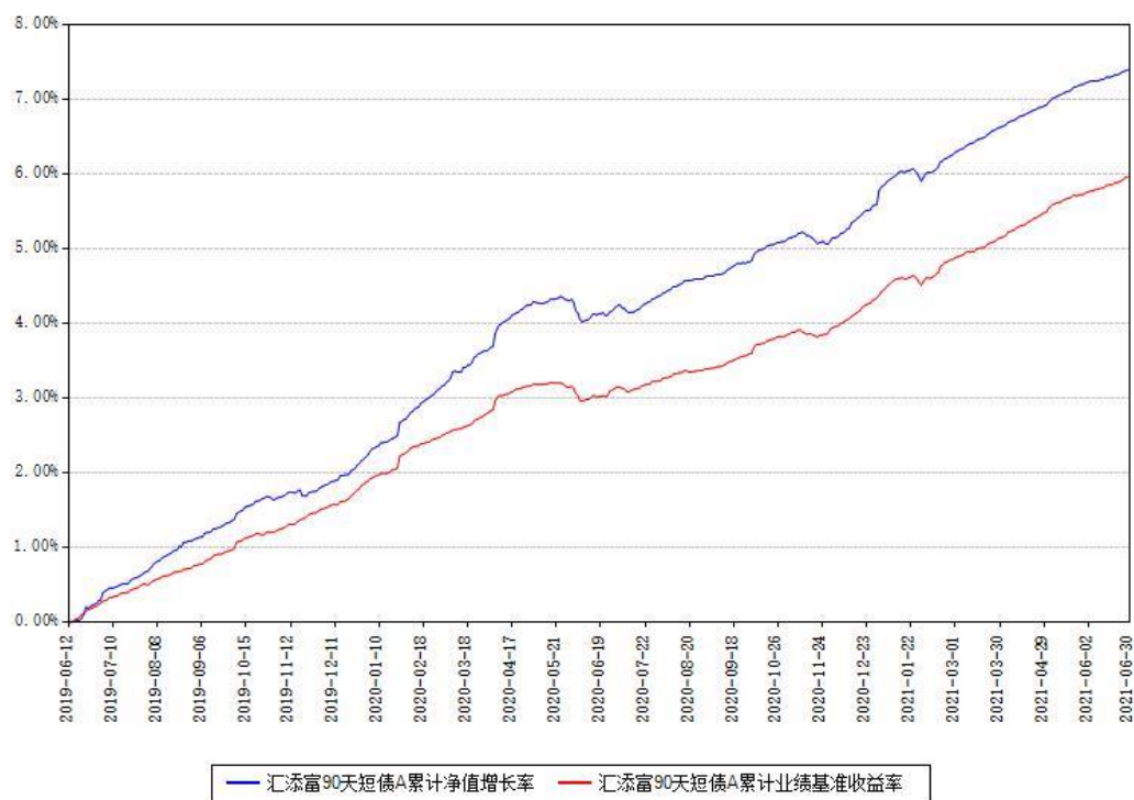
汇添富90天短债A累计净值增长率与同期业绩比较基准收益率对比图