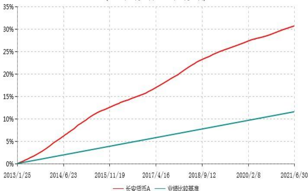
长安货币A累计净值收益率与业绩比较基准收益率历史走势对比图 (2013年01月25日-2021年06月30日)

本基金的收益分配是按月结转份额。按基金合同规定，本基金自基金合同生效起 6 个月为建仓期，截止到建仓期结束时，本基金的各项投资组合比例已符合基金合同的相关规定。图示日期为 2013 年 1 月 25 日至 2021 年 6 月 30 日。