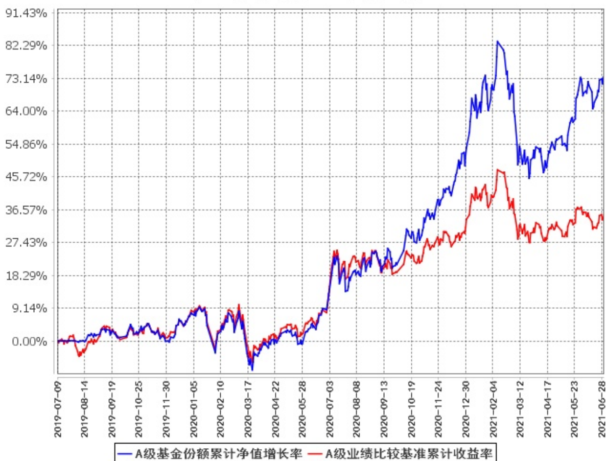
A级基金份额累计净值增长率与同期业绩比较基准收益率的历史走势对比图 (2019年7月9日至2021年6月30日)