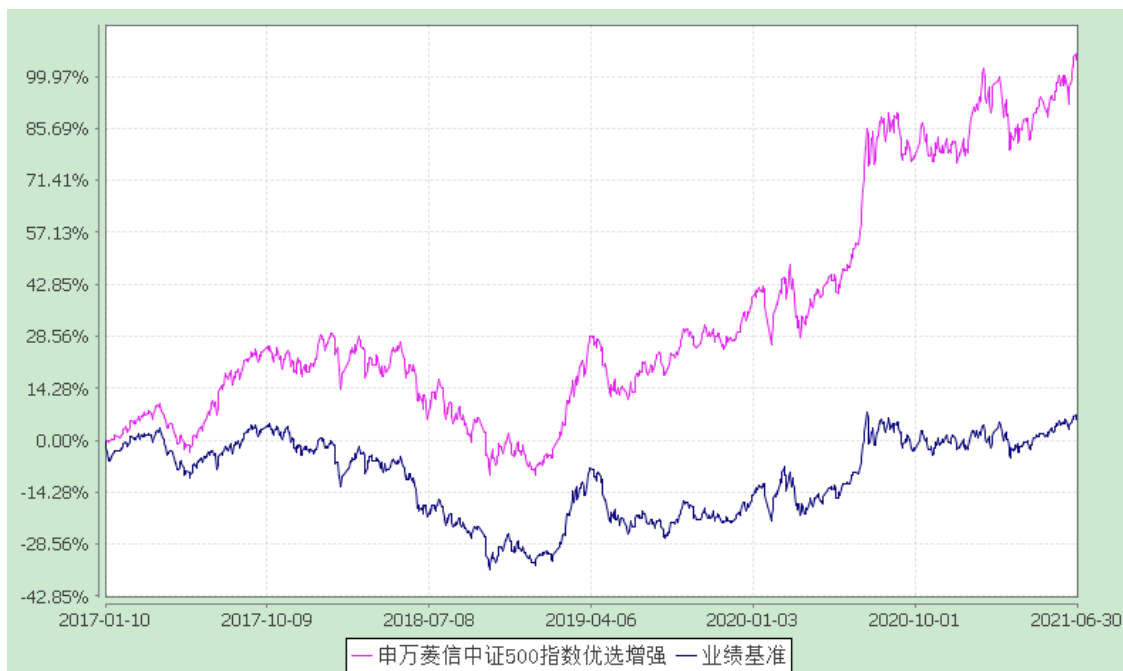
申万菱信中证 500 指数优选增强 C