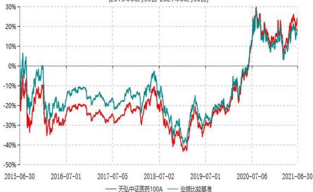
天弘中证医药100C累计净值增长率与业绩比较基准收益率历史走势对比图