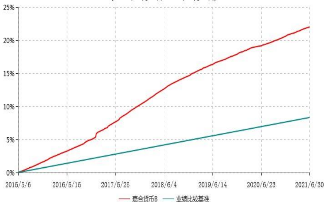
嘉合货币B累计净值收益率与业绩比较基准收益率历史走势对比图 (2015年05月06日-2021年06月30日)