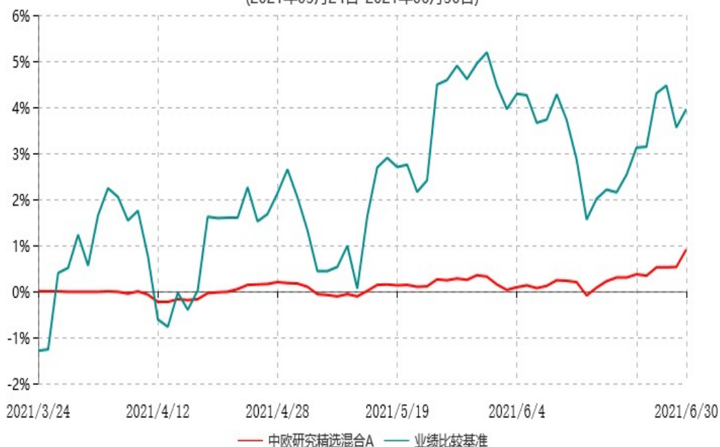
中欧研究精选混合A累计净值增长率与业绩比较基准收益率历史走势对比图 (2021年03月24日-2021年06月30日)

注：本基金基金合同生效日期为 2021 年 3 月 24 日，自基金合同生效日起到本报告期末不满一年，按基金合同的规定，本基金自基金合同生效起六个月为建仓期，建仓期结束时各项资产配置比例应当符合基金合同约定。