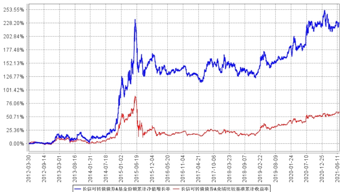
长信可转债债券A基金份额累计净值增长率与同期业绩比较基准收益率的历史走势对比图