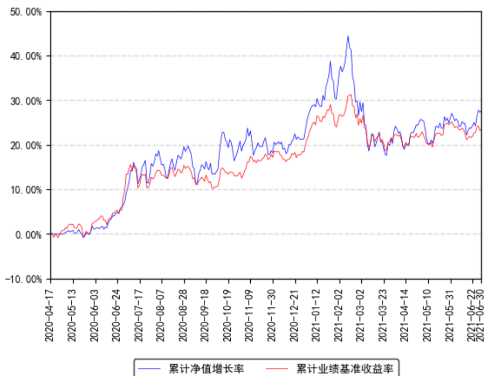
南方瑞盛三年混合A累计净值增长率与同期业绩比较基准收益率的历史走势对比图