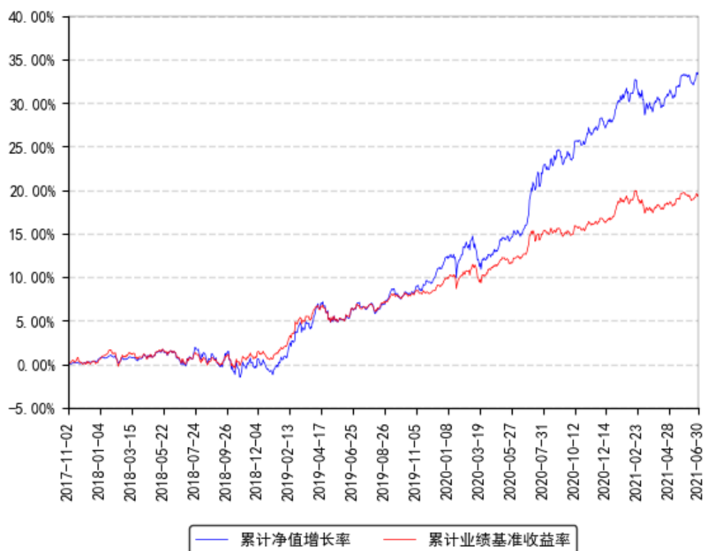
南方安福混合A累计净值增长率与同期业绩比较基准收益率的历史走势对比图