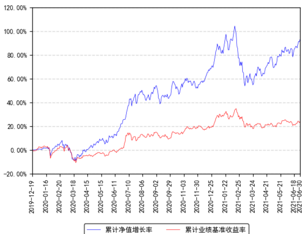
南方 ESG 主题股票 A 累计净值增长率与同期业绩比较基准收益率的历史走势对比图