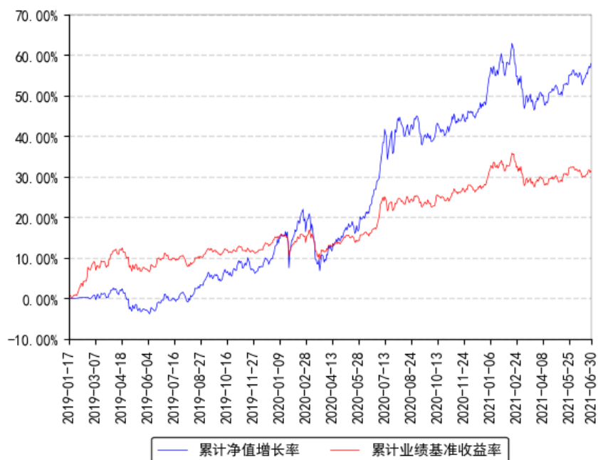
南方合顺多资产配置混合 (FOF) A 级累计净值增长率与同期业绩比较基准收益率的历史走势对比图