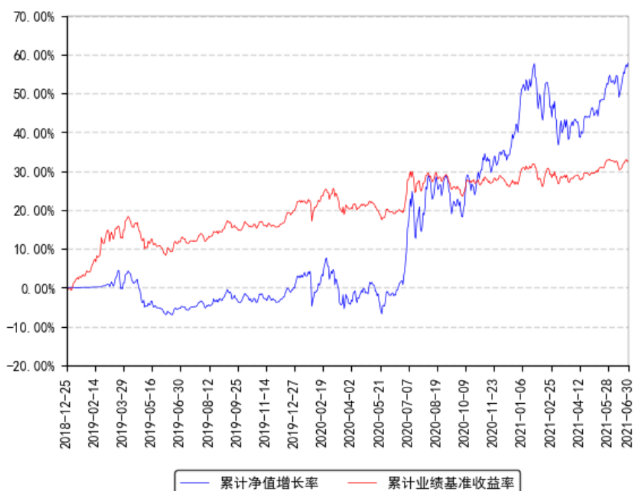
南方昌元可转债债券A级累计净值增长率与同期业绩比较基准收益率的历史走势对比图