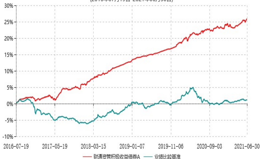
财通资管积极收益债券A累计净值增长率与业绩比较基准收益率历史走势对比图 (2016年07月19日-2021年06月30日)