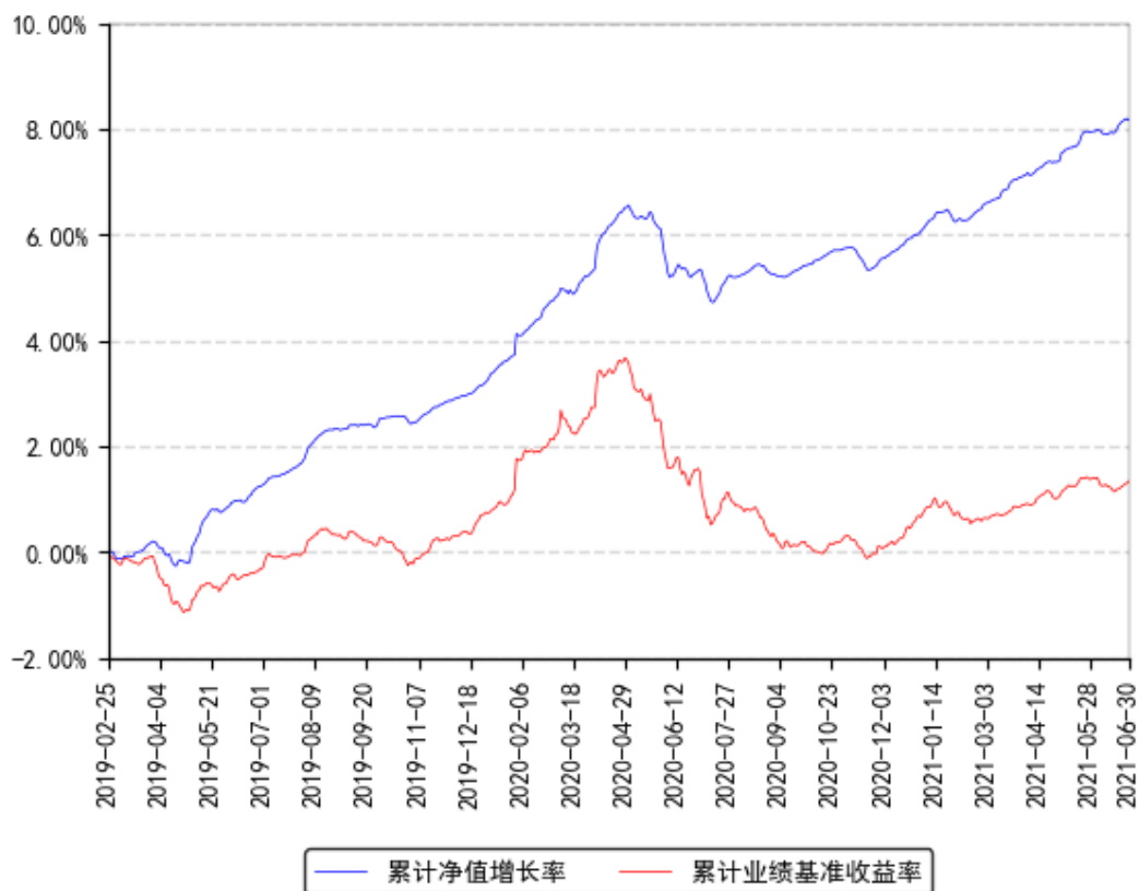
南方华元A累计净值增长率与同期业绩比较基准收益率的历史走势对比图