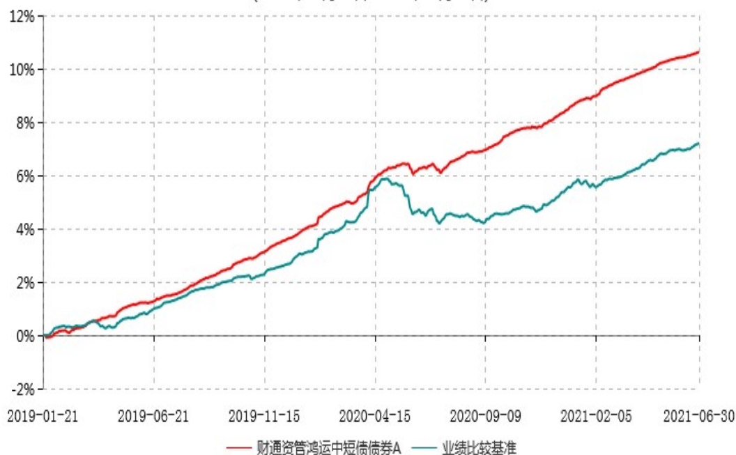
财通资管鸿运中短债债券A累计净值增长率与业绩比较基准收益率历史走势对比图 (2019年01月21日-2021年06月30日)