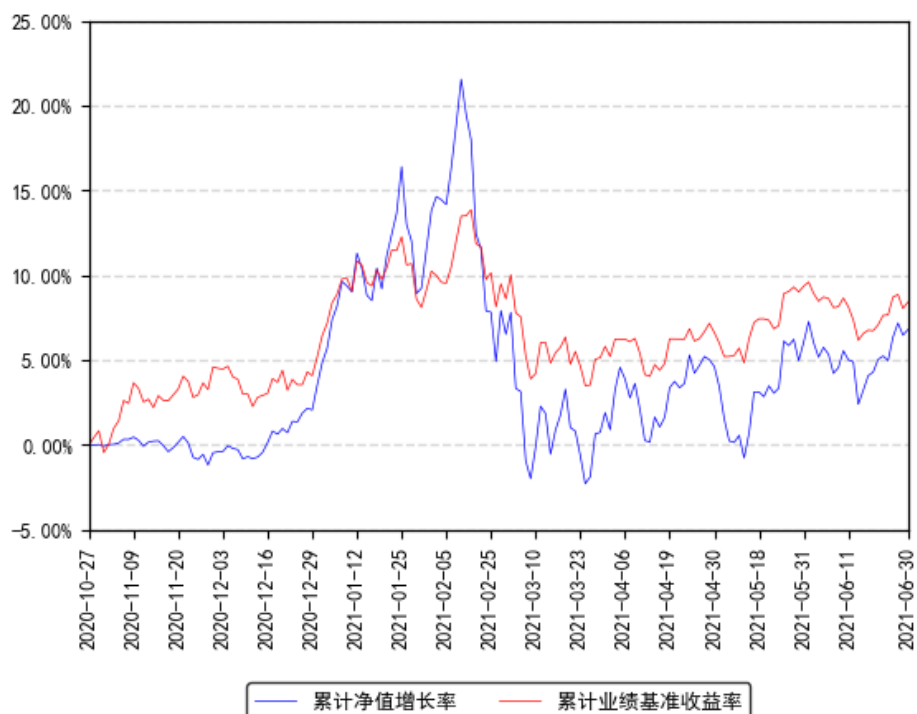
南方行业精选一年混合A累计净值增长率与同期业绩比较基准收益率的历史走势对比图