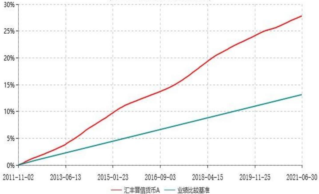
汇丰晋信货币A累计净值收益率与业绩比较基准收益率历史走势对比图 (2011年11月02日-2021年06月30日)