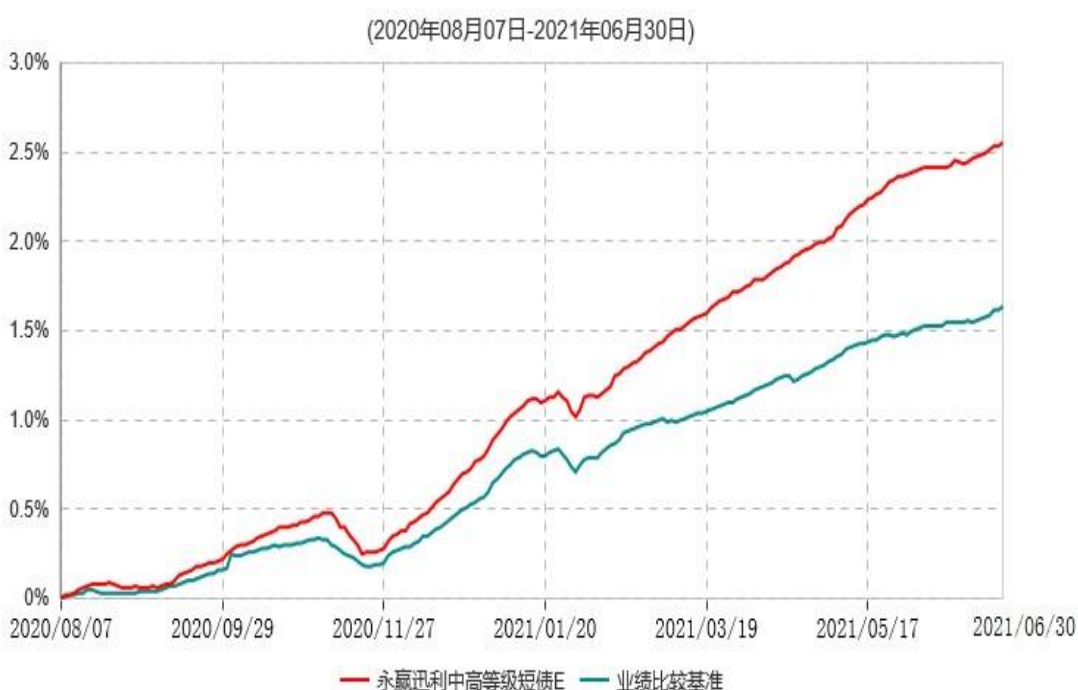
永赢迅利中高等级短债E累计净值增长率与业绩比较基准收益率历史走势对比图

注：本基金自 2020 年 8 月 7 日增设 E 类基金份额，截至本报告期末，本类基金份额生效未满 1 年。