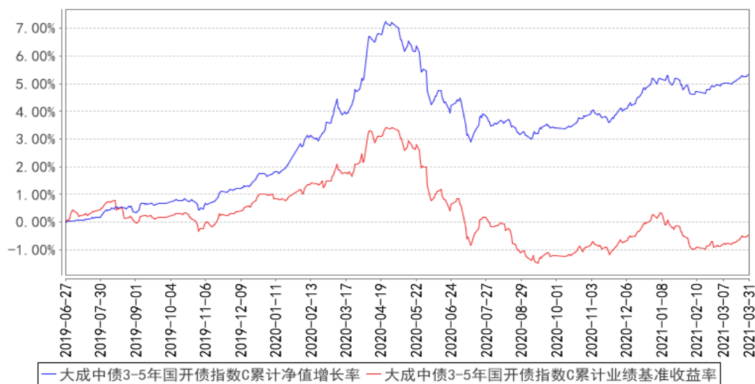
大成中债3-5年国开债指数C累计净值增长率与同期业绩比较基准收益率的历史走势对比图

注：本基金合同规定，基金管理人应当自基金合同生效之日起六个月内使基金的投资组合比例符合基金合同的约定。建仓期结束时，本基金的投资组合比例符合基金合同的约定。