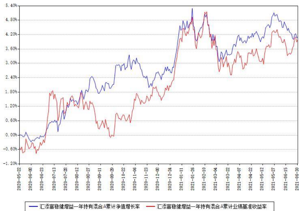
汇添富稳健增益一年持有混合A累计净值增长率与同期业绩基准收益率对比图