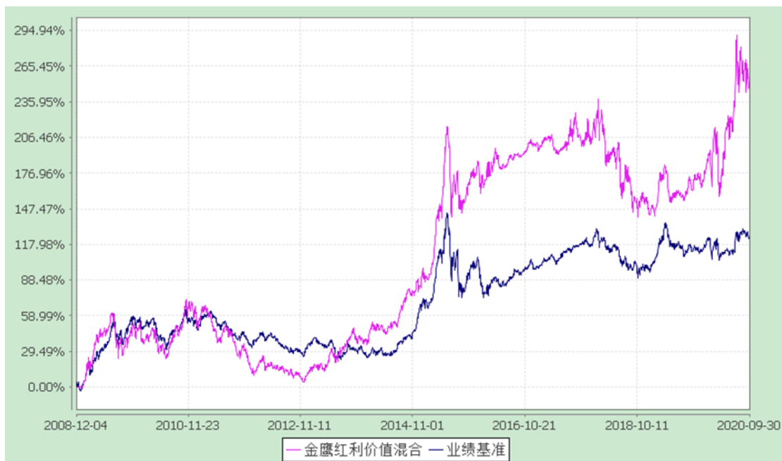
金鹰红利价值灵活配置混合型证券投资基金 累计净值增长率与业绩比较基准收益率历史走势对比图 (2008年12月4日至2020年9月30日)