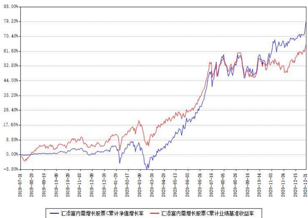
汇添富内需增长股票C累计净值增长率与同期业绩基准收益率对比图