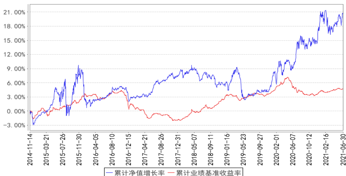
融通瑞债券A/B累计净值增长率与同期业绩比较基准收益率的历史走势对比图