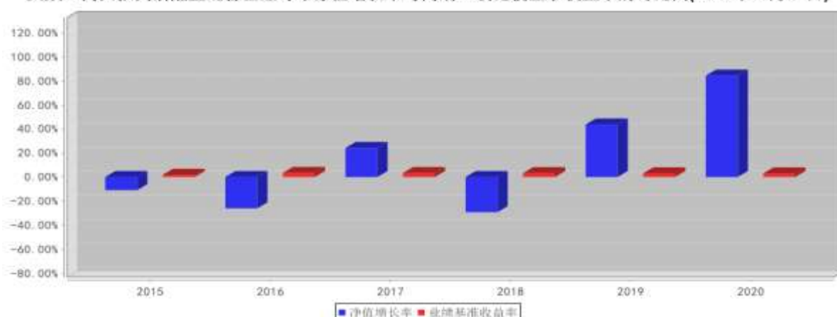
大成正向回报灵活配置混合基金每年净值增长率与同期业绩比较基准收益率的对比图(2020年12月31日)

注:1、基金的过往业绩不代表未来表现。 2、如合同生效当年不满完整自然年度的,按实际期限计算净值增长率。