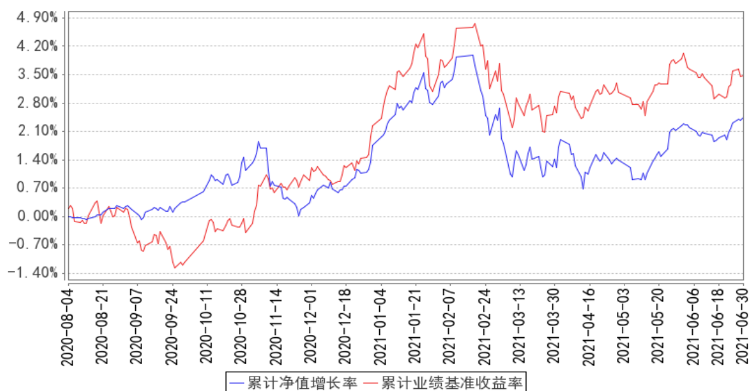
民生加银家盈6个月持有期债券A 累计净值增长率与同期业绩比较基准收益率的历史走势对比图