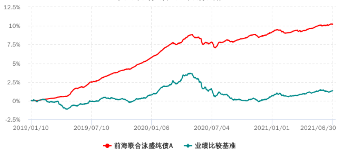
前海联合泳盛纯债A累计净值增长率与业绩比较基准收益率历史走势对比图 (2019年01月10日-2021年06月30日)